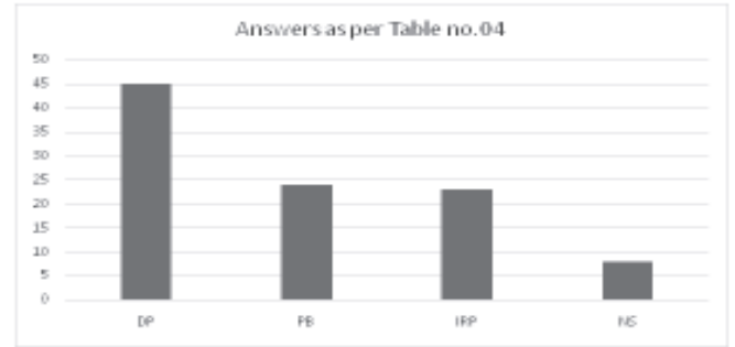
चित्र 3 — प्रतिभागियों से प्राप्त उत्तर