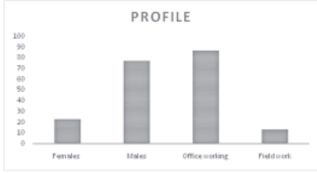
चित्र 1 — ग्राफ़ प्रतिभागियों के जनसांख्यिकीय प्रोफाइल